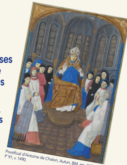
Pontifical d'Antoine de Chalon, Autun, BM, ms. S151(129), f° 91, v. 1490.