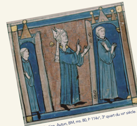
Décret de Gratien, Autun, BM, ms. 80, f° 114v, 3 e quart du xiv e siècle.

10-12 mai 2017 Université Grenoble Alpes