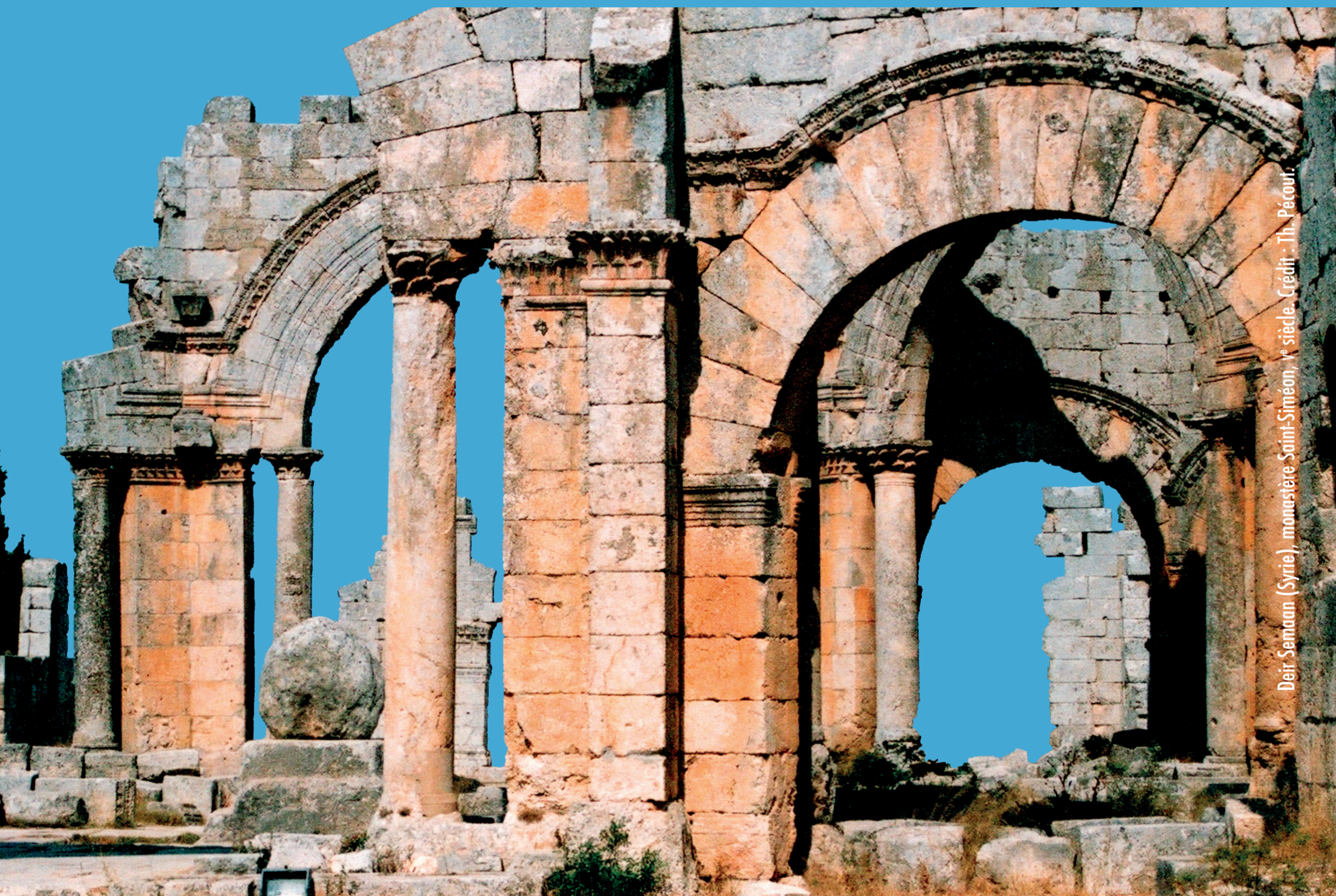
Deir Semaan (Syrie), monastère Saint-Siméon, V e siècle.