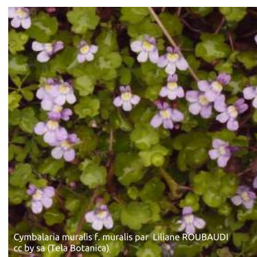
Cymbalaria muralis f. muralis