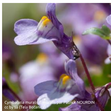
Cymbalaria muralis f. muralis par Patrick NOURDIN cc by sa (Tela Botanica)

Elle apprécie les climats doux et craint les grands froids. Elle affectionne donc les villes, où elle retrouve une température clémente du fait de l'intense activité humaine.