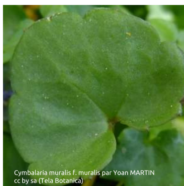
Cymbalaria muralis f. muralis par Yoan MARTIN cc by sa (Tela Botanica)