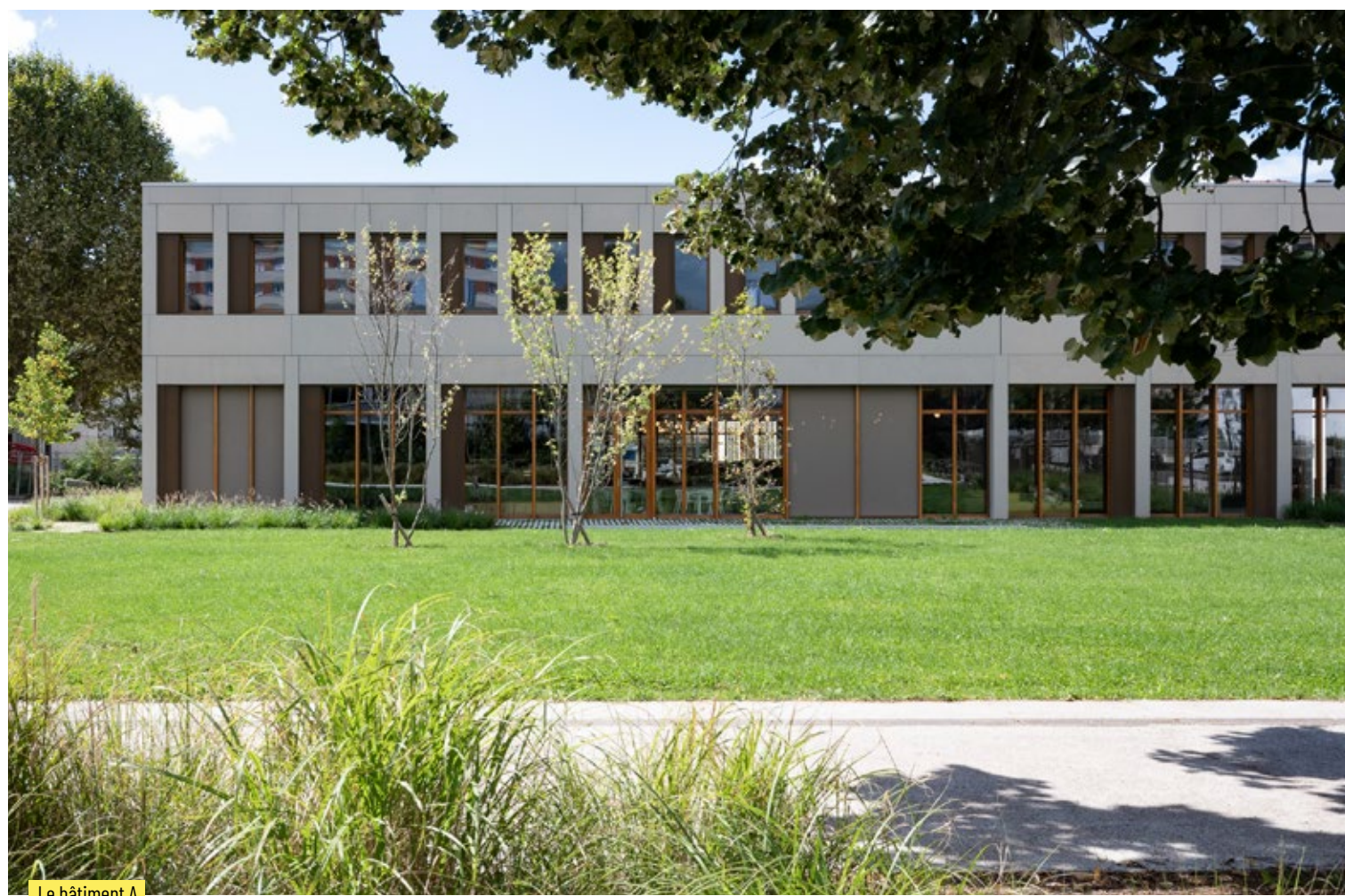
Le bâtiment A