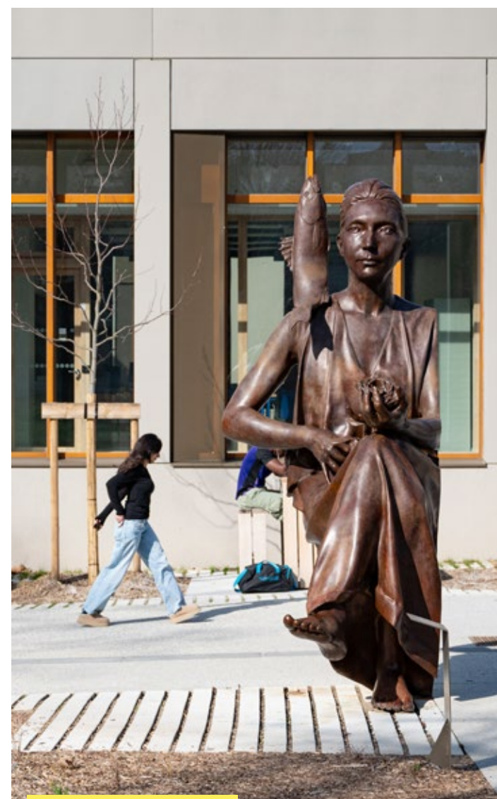
Femme qui Marche de Benoît Maire