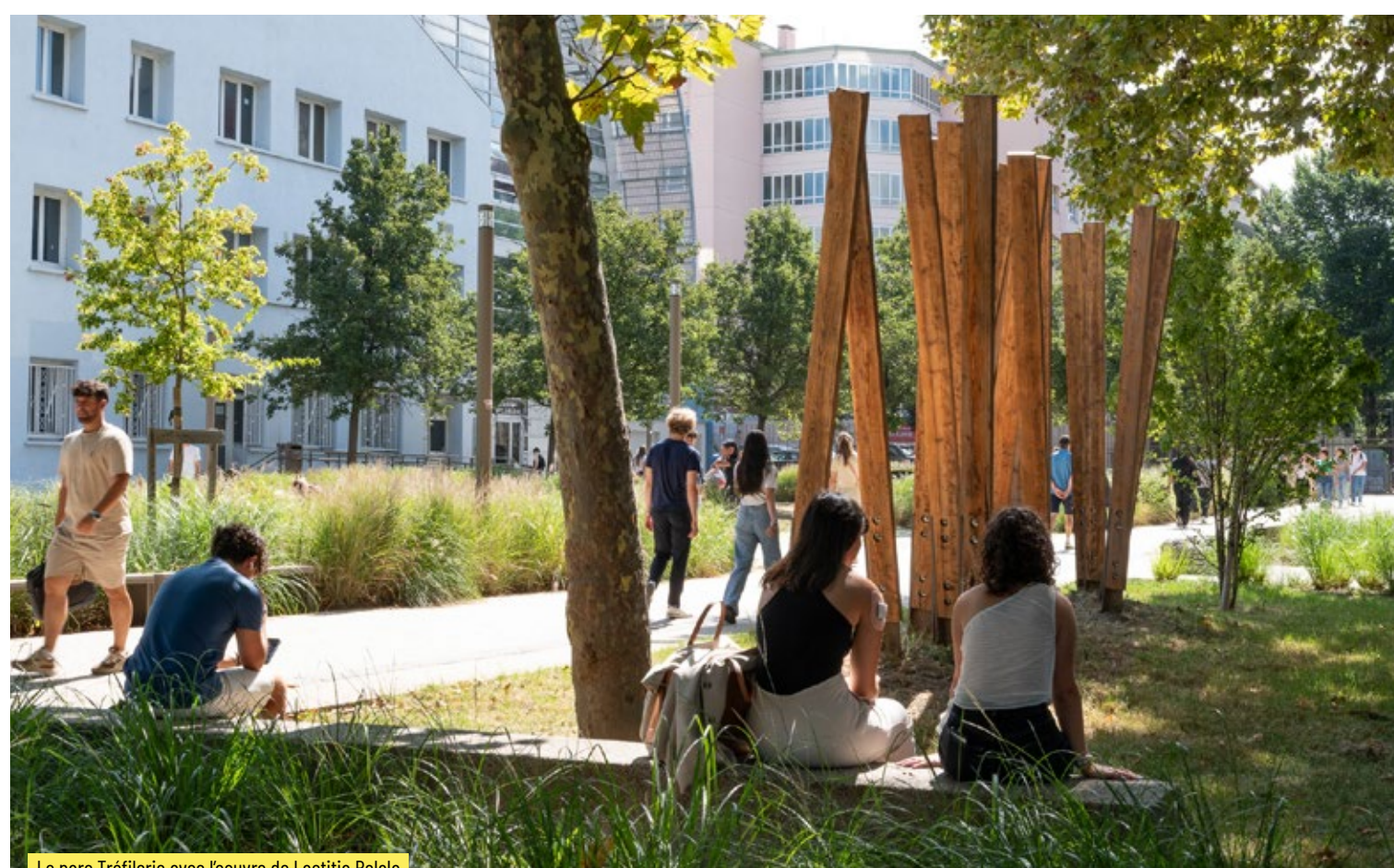
Le parc Tréfilerie avec l'oeuvre de Laetitia Belala

La rénovation du Campus Tréfilerie comprend la transformation de l'ancienne rue Tréfilerie en un parc végétalisé de 15 000 m² ④ magnifié et identifié par sa grille. Labellisé refuge LPO (Ligue pour la Protection des Oiseaux), à l'instar des autres campus de l'Université, cet espace calme et verdoyant propose une véritable bulle de respiration aux étudiantes et aux étudiants. Composé de zones de détente et de restauration conviviales, il favorise les échanges et la sociabilisation au sein d'un environnement protégé de l'agitation urbaine. Arboré et fleuri, il intègre 80 nouveaux arbres (érables, chênes, sophoras et noisetiers), qui s'ajoutent aux 92 déjà présents, ainsi que 7000 m² de pelouse et 4500 m² de massifs qui font le bonheur de la faune et de la flore. Sa nouvelle configuration encourage la primauté des modes de déplacement doux comme la marche ou le vélo. Traversé librement par les usagers de l'Université et les citoyens, le parc Tréfilerie est rapidement devenu un poumon vert apprécié au cœur de l'agglomération.