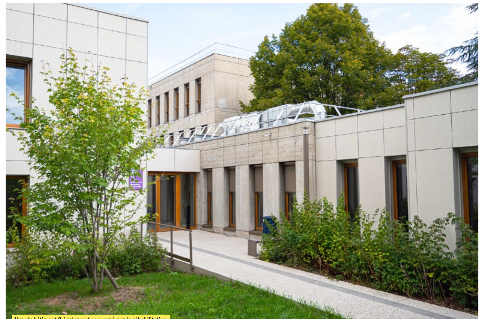
Vue du bâtiment G également concerné par la réhabilitation

Ces différents espaces ont été entièrement réhabilités ⑦. Ils sont désormais plus lumineux, pratiques et moins énergivores. Les salles de classe au design épuré ont été reconfigurées pour faciliter une pédagogie innovante et plus inclusive. Matériel numérique et audiovisuel neuf, nouveaux supports de travail et isolation acoustique et thermique améliorée participent désormais à un déroulé optimal des études et des gains énergétiques importants. La rénovation d'un amphithéâtre et l'installation d'un nouveau mobilier modulaire dans les salles de cours répondent pour leur part à l'émergence de la pédagogie dite inversée qui autorise la variété des formats de réunion. Les deux bâtiments offrent également une zone propice à la convivialité et aux échanges. Le cœur de la structure accueille un foyer, au rez-de-chaussée, repensé autour du patio intérieur et son bassin d'ornement. Il permet aux étudiants de se restaurer dans un cadre à la fois moderne et chaleureux. Le hall principal s'ouvre sur une zone de détente qui ajoute à la convivialité du lieu.