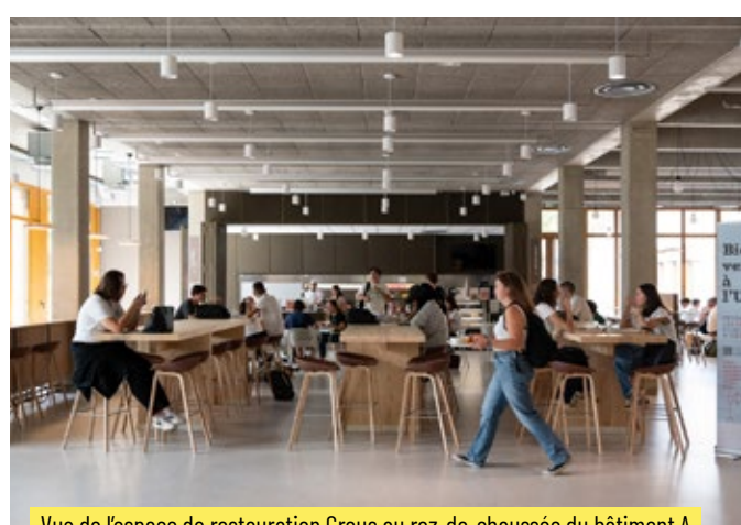
Vue de l'espace de restauration Crous au rez-de-chaussée du bâtiment A

La salle de spectacles de la Maison de l'Université Située au rez-de-chaussée ②, elle est un lieu d'expression et d'ouverture au monde de la culture et des arts. Elle propose une programmation universitaire riche et s'ouvre aussi à des festivals (Fest'U de l'UJM, Arcomik, Festival des Accents, etc.). Cette salle est devenue au fil du temps une scène prisée à l'échelle locale. D'une capacité de 170 places, elle accueille chaque année plus de 40 événements (musique, danse, théâtre, lecture, etc.).