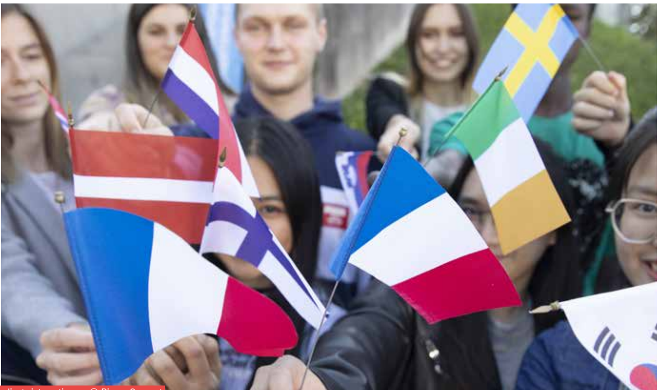
Étudiants internationaux

Cette dynamique d'ouverture s'intensifiera avec le renforcement de l'offre de parcours internationaux attractifs, en encourageant les mobilités de nos étudiants et en renforçant les dispositifs d'accueil et les conditions d'études des étudiants étrangers.