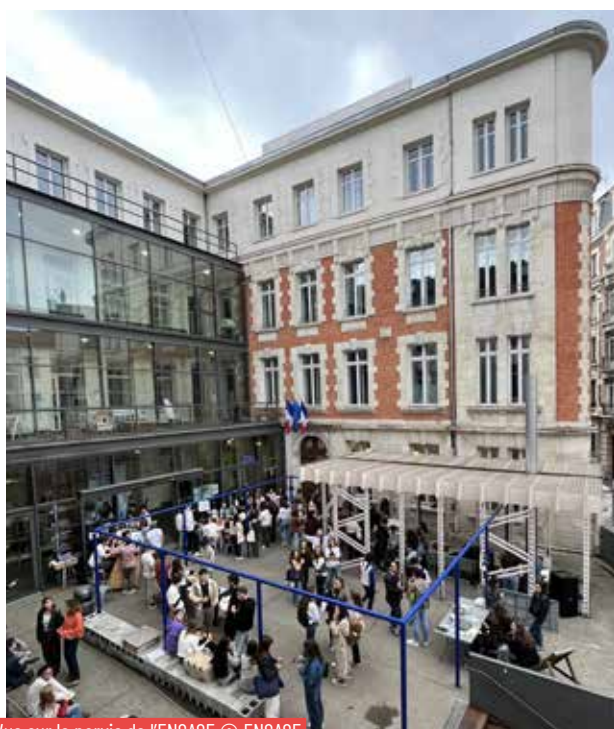
Vue sur le parvis de l'ENSASE

Dans le cadre de l'évolution de l'UJM en Établissement Public Expérimental (EPE) et, à terme, en Grand Établissement, la priorité est de garantir un développement équilibré de l'établissement aux plans académique, financier et organisationnel. Pour atteindre cet objectif, un dialogue privilégié et fondé sur la confiance sera maintenu avec les composantes, les services de proximité seront développés par la généralisation d'une politique de déconcentration, tout en veillant à la soutenabilité du modèle économique.