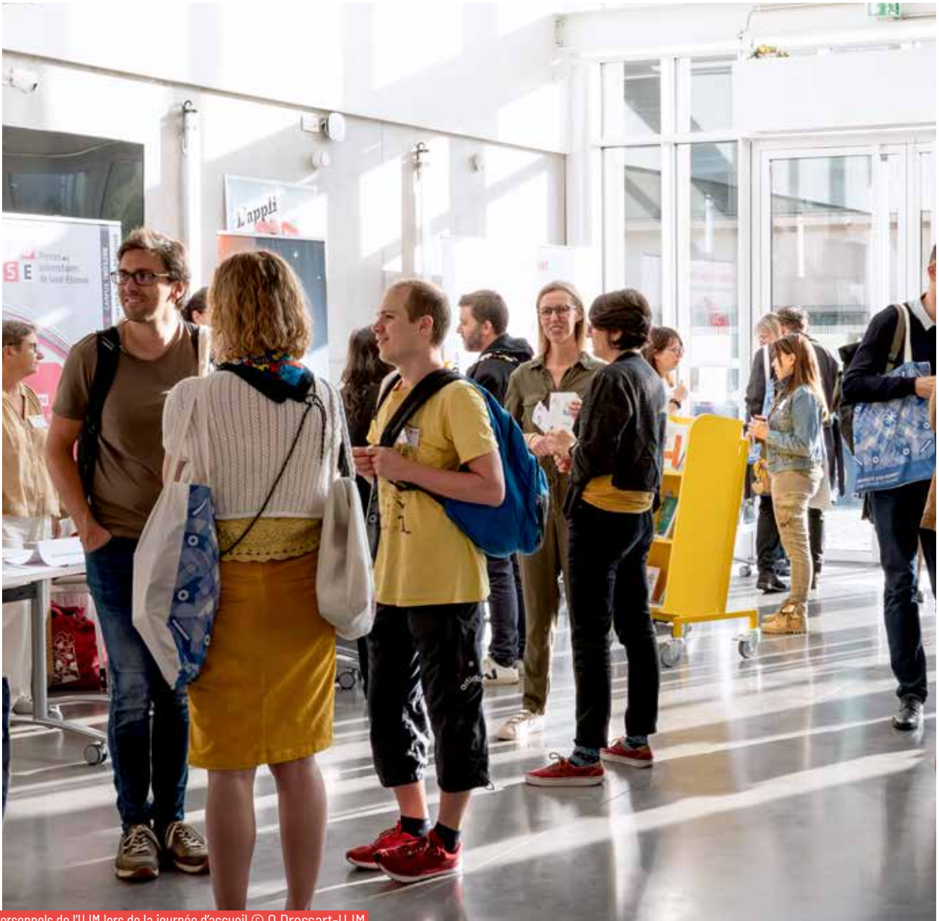
Personnels de l'UJM lors de la journée d'accueil

> Maintenir une politique sociale ambitieuse pour l'amélioration de la qualité de vie au travail (QVCT), et en faveur des carrières de tous les personnels (politique indemnitaire, politique volontariste de formation/ de mentorat et de mobilité interne...).