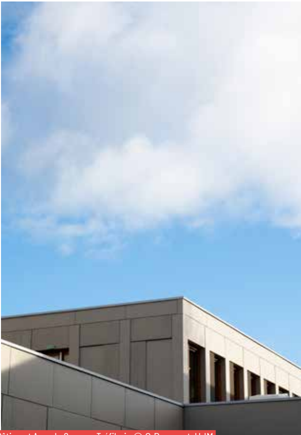
Bâtiment A sur le Campus Tréfilerie

Le projet d'établissement s'inscrit dans la volonté de promouvoir une gouvernance responsable et engagée. Chaque membre de la communauté universitaire doit pouvoir contribuer pleinement à un projet collectif fondé sur l'égalité des chances, la responsabilité sociale et environnementale et sur les valeurs universitaires.