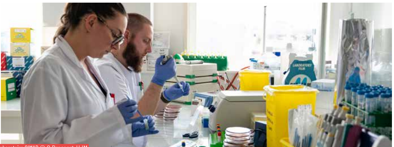
Laboratoire GIMAP