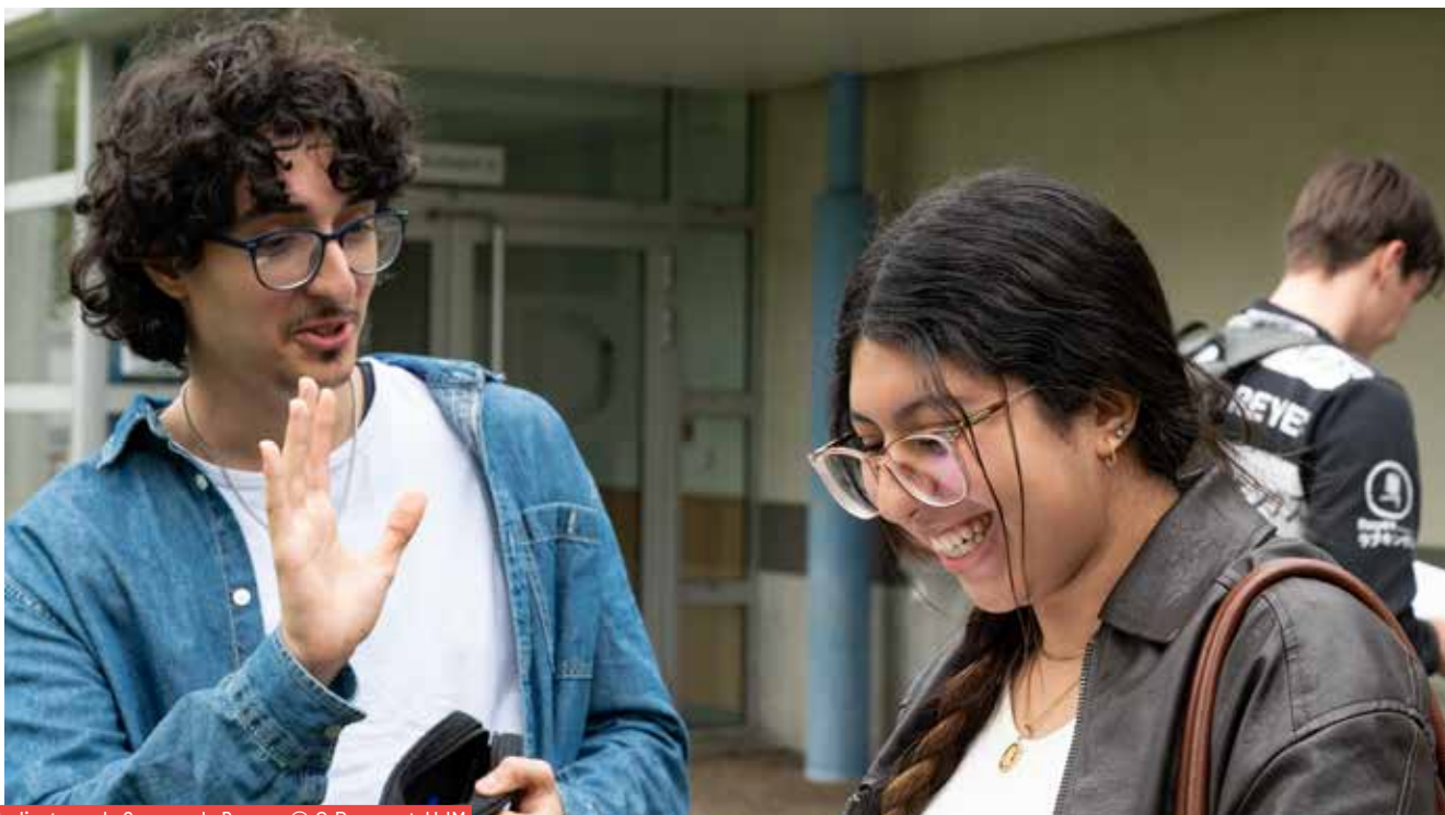
Étudiants sur le Campus de Roanne

> Pérenniser et renforcer les dispositifs d'intégration pour faciliter la transition lycée-université dès l'entrée à l'université par une politique active d'accueil et d'orientation en partenariat avec les acteurs du secondaire. Dans un environnement de l'enseignement supérieur qui se complexifie, l'Université doit être exemplaire dans sa mission d'accueil et d'information auprès des lycéens et de leurs familles.