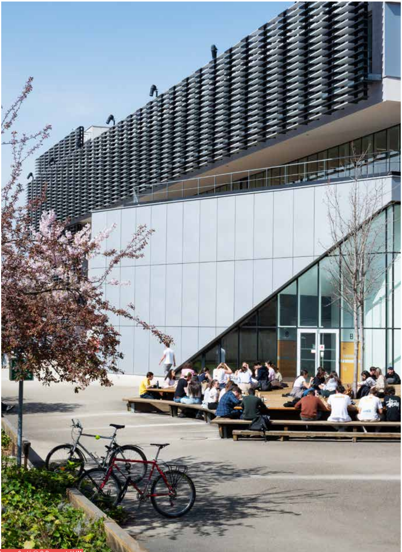
Campus Santé