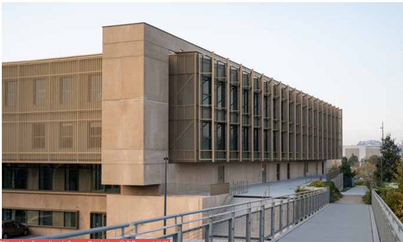
Bâtiment Les Forges II sur le Campus Manufacture

l'ouverture prochaine d'un cycle ingénieur TSE à Roanne, le double diplôme de Master en management du sport et activité physique adaptée, en partenariat interne entre le département STAPS de la Faculté des sciences et l'IAE, démontrent le potentiel de projets de formation originaux que nous pouvons construire ensemble.